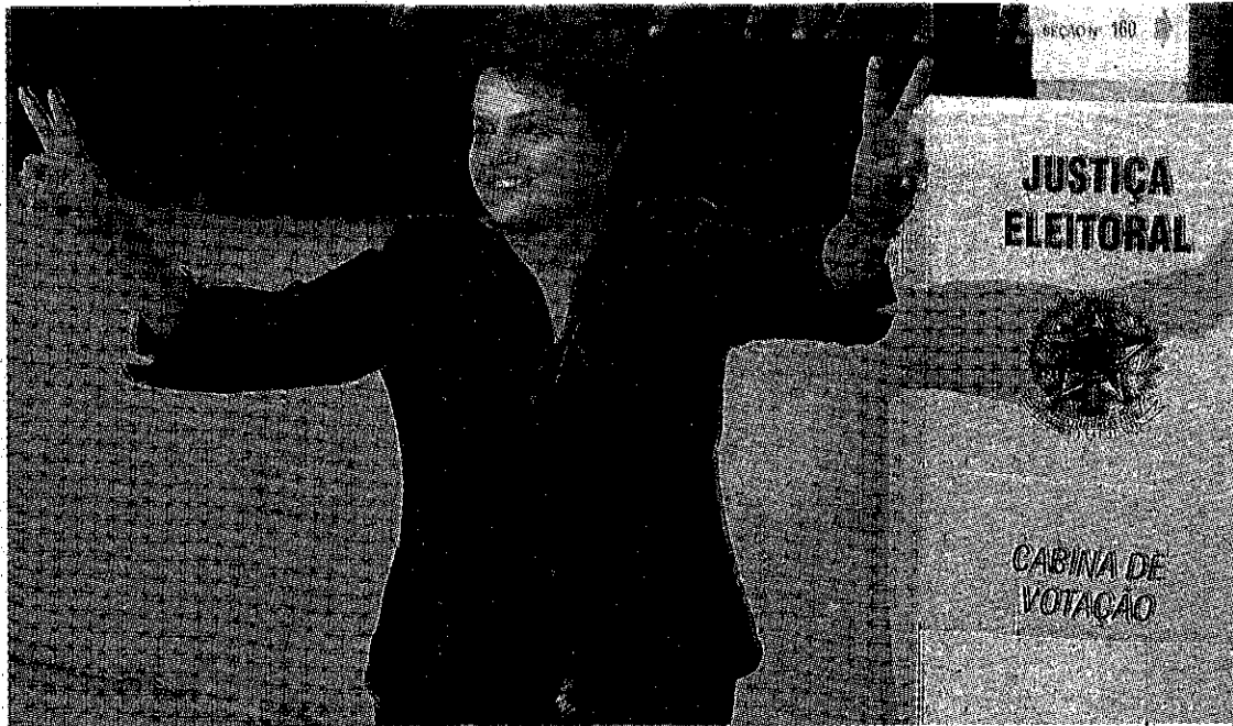
Dilma Rousseff au bureau de vote hier

La candidate du Parti des Travailleurs (PT-